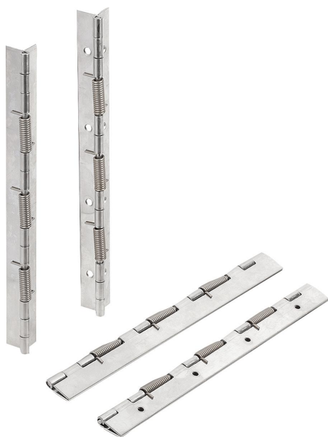
Gångjärn med låsfjäder